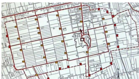
Koloniehoeves en limiethuisjes

Na 1859, toen de kolonie een rijksinstelling werd, zijn deze hutten vervangen door een 15-tal zogenoemde limiethuisjes. Een limiethuisje is een op een tolhuis gelijkend woonhuis van waaruit de landerijen van de Rijkswerkinrichting konden worden bewaakt. De ramen in de huisjes waren zodanig geplaatst dat men vanuit elk huisje vrij zicht had op het volgende huisje. Het limiethuisje aan de Boslaan is het laatst overgebleven exemplaar.