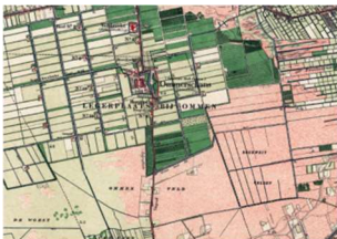
Topografische kaart 1896

Het gaat in alle zes de gevallen om ceremoniële of rituele zwaarden die niet geschikt waren om mee te vechten. Daarvoor zijn ze te mooi, te groot en te zwaar. Het Zwaard van Ommerschans bijvoorbeeld is bijna 70 cm lang en weegt bijna 3 kg. De zwaarden moesten vermoedelijk vooral indruk maken door hun formaat en hun schoonheid.