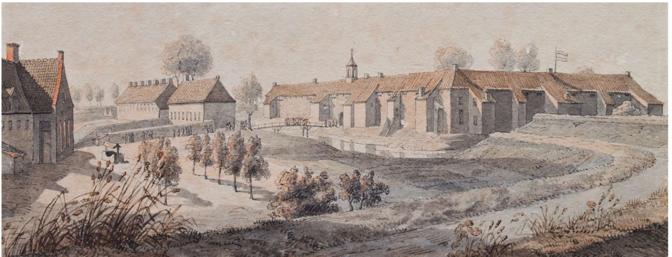
Zuidoostzijde van de Ommerschans (omstreeks 1825)

Op initiatief van Johannes van den Bosch was in 1818 de Maatschappij van Weldadigheid opgericht met als doel om 'luilevende armen', bedelaars, landlopers, vondelingen en wezen op te voeden tot zedelijkheid en een bestaan te bieden op zogenaamde, nieuw te vestigen, landbouwkoloniën. Het was een ambitieus plan met als doel om de armoede in de Noordelijke en Zuidelijke Nederlanden te bestrijden. Als eerste wordt de proefkolonie Frederiksoord opgericht, spoedig gevolgd door Frederiksoord, Willemsoord en Wortel. Het zijn zogenaamde vrije koloniën waar men, weliswaar onder toezicht maar in betrekkelijke vrijheid, kleinschalige landbouw kan beoefenen. Voor niet-werkwilligen worden onvrije koloniën gesticht, waar men niet vrij is en onder dwang arbeid moet verrichten. Dat zijn de Ommerschans, Veenhuizen en Merksplas.