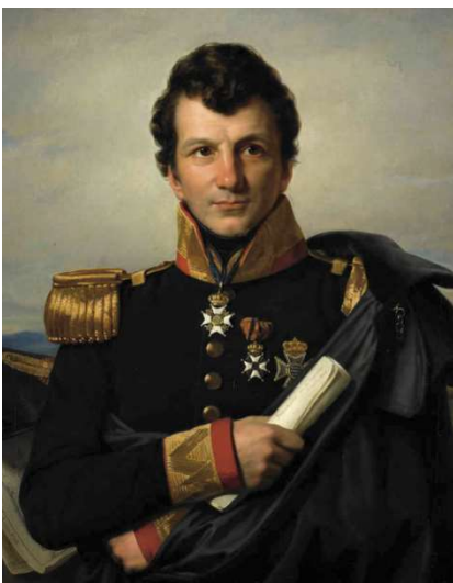
Johannes van de Bosch

Beide mannen hebben elkaar meerdere keren ontmoet. De eerste keer in 1819, toen Van den Bosch zich oriënteerde op de vestiging van een bedelaarsgesticht op en rond de Ommerschans en Van Dedem het belang daarvan voor zijn eigen hoofdactiviteit - de voltooiing van de Dedemsvaart - direct onderkende.