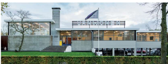
Zwolle: kantoor firma Schrale Beton)

Niet veel mensen zullen weten dat in Dedemsvaart ook een gebouw te vinden is dat door Rietveld is ontworpen. Het is mede te danken aan de toenmalige burgermeester van Avereest, tevens voorzitter van de Gemeentelijke Spaarbank, dat het zover is gekomen. Het bestuur van de Spaarbank verleende Rietveld, waarmee goede contacten waren opgebouwd in verband met het ontwerp voor een Cultureel Centrum in Dedemsvaart, in de zestiger jaren van de vorige eeuw namelijk de opdracht tot het ontwerp van een nieuw te bouwen hoofdvestiging van de bank. Het gemeentebestuur was eerder gecharmeerd geraakt van de ontwerpen van Rietveld, onder meer door zijn ontwerp voor het kantoorgebouw van de firma Schrale Beton aan de Willemsvaart in Zwolle.