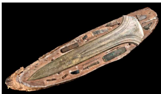
Het zwaard van Ommerschans

Ogenschijnlijk is er niet veel te zien langs de Maatschappijwijk. Toch is de locatie bijzonder omdat hier, in het perceel ten noorden van de weg, ter hoogte van huisnummer 6, in 1896 een voorwerp is gevonden dat sindsdien wordt gerekend tot één van de meest zeldzame en bijzondere objecten uit de Nederlandse en Europese prehistorie: het Zwaard van Ommerschans, icoon van de Nederlandse archeologie.