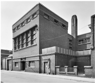
Almelo: Huis van Bewaring

In 1923 werd hij benoemd tot hoofdarchitect van de Rijksgebouwendienst. In die hoedanigheid ontwierp hij onder andere het voormalige Huis van Bewaring aan de Marktstraat in Almelo (nu: rijksmonument/hotel).