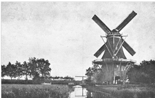
De Star (omstreeks 1900)

Korenmolen De Star is in 1848 gebouwd door molenaar Jan ten Kate. De Star stond oorspronkelijk niet ver van de Dedemsvaart, in het centrum van Balkbrug, waar het graan gemakkelijk per schip kon worden aangevoerd. Na demping van het kanaal is de molen in 1975 over ruim 500 meter verplaatst naar de huidige locatie.