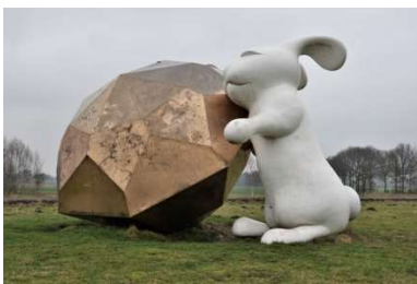
C I love you

Halverwege het Kotermeerstalpad, ter hoogte van het daar aangelegde strand, is op enige afstand aan de rechterkant van het pad op een zichtheuvel een vreemd object waarneembaar dat bij nadere beschouwing blijkt te bestaan uit een jong konijn dat een enorm bronzen diamant omarmt.