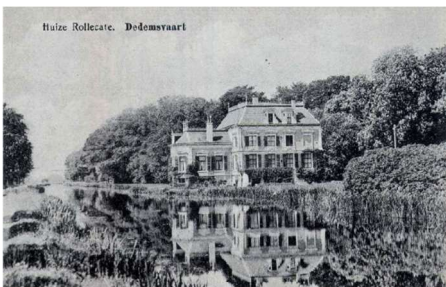
Huize Rollecate ( Den Hulst, omstreeks 1900)

"Men denke slechts aan de Dedemsvaart, die schepping van één menschenleven. Als jongeling zag de Baron van Dedem, onlangs overleden, die uitgestrektheid gronds in doodsche stilte, en eer hij de oogen sloot, aanschouwde hij er de Dedemsvaart, als zijn werk, omzoomd door heerlijke landerijen en weiden en eene bevolking van meer dan 6000 zielen daarop en daarvan levende, terwijl handel en nijverheid er bloeide en der schatkist 's jaarlijks duizende guldens van daar toevloeit!"