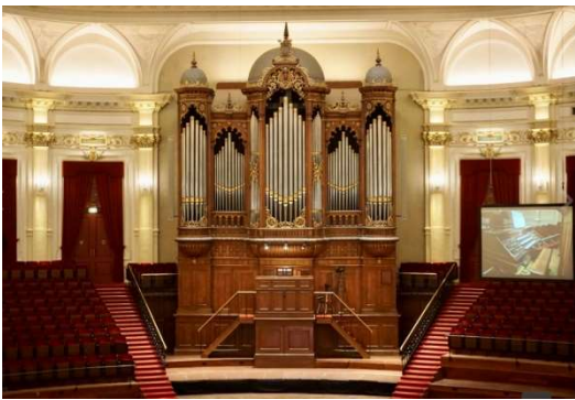
Orgel Concertgebouw A'dam