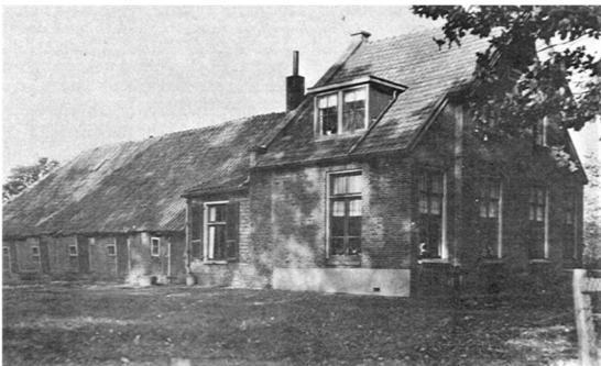
Hoeve nr. 11

Na de sluiting van het bedelaarsgesticht in 1890 werden de koloniegronden en de hoeves geleidelijk aan verkocht. Van de 21 kolonieboerderijen zijn er slechts drie bewaard gebleven, namelijk de hoeves nr. 8 en nr. 11 aan de 1ste Schansweg en hoeve nr. 4 aan de Balkerweg. Hoewel ze in de loop van de tijd meerdere keren zijn verbouwd en uitgebreid zijn ze nog goed als zodanig herkenbaar.