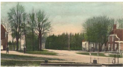
Uiterst rechts: de herberg van Kruizinga (omstreeks 1905)

- Meerpaal 3 verwijst naar het voormalige, in 1862 gebouwde, gemeentehuis van Avereest en de ernaast liggende burgemeesterswoning. Het eerste gemeentehuis van Avereest, opgericht in 1815, stond feitelijk in Balkbrug, waar in de herberg van Kruizinga een secretarie was ingericht en waar de raadsvergaderingen werden gehouden