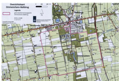
Beschermd dorpsgezicht Ommerschans-Balkbrug

"De historische gelaagdheid van het landschap, gevormd door militaire [de schans], sociaaleconomische [de bedelaarskolonie] en pedagogisch-penitentiaire [Veldzicht] ontwikkelingen, is nog duidelijk herkenbaar in de ruimtelijke structuur. (...) Zo is een uniek geheel ontstaan, opgebouwd uit cultuur-, architectuur- en ruimtelijk-historische waarden van verschillende aard."