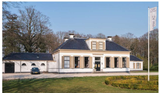
Veenhuizen: Klein Soestdijk